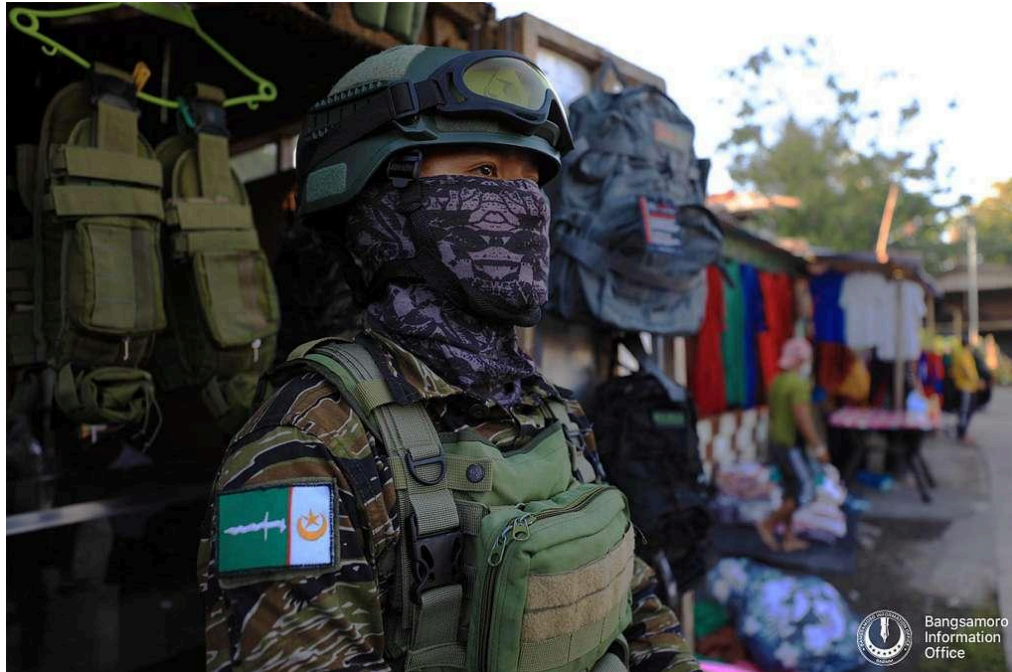
Bangsamoro Information Office

NMIP ay ginagamitan ng mga armadong pagbabanta mula sa MILF, MNLF, mga angkan, pulitiko, mula sa Bangsamoro Islamic Freedom Fighters, at mga korporasyon. Gayong ang pangunahing tugon ng mga NMIP sa aramadong mga sigalot ay paglikas, naitala sa isang malayang imbestigasyon ng tagapagbalita na Rappler na limampu't-limang Teduray Lambangian na ang napapatay sa BARMM simula noong 2018. 30