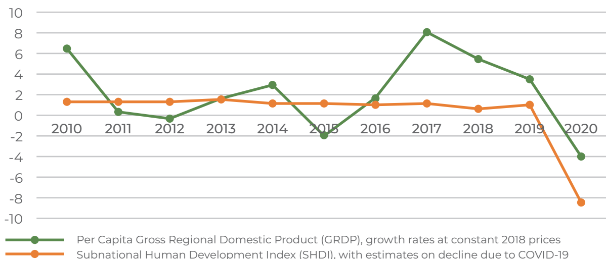
Figure 3. Ang tinuod nga pag-uswag sa GDP per capita sa BARMM ug Subnational Human Development Index sulod sa napulo ka tuig. Sources: Philippine Statistics Authority 2000-2020 Gross Regional Domestic Product data series, retrieved from https://psa.gov.ph/sites/default/files/GRDP_Reg_2018PSNA_2000-2020_0.xlsx and UNDP in the Philippines 2021 report, “The Socioeconomic Impact Assessment of COVID-19 on the Bangsamoro Autonomous Region in Muslim Mindanao,” retrieved from https://www.ph.undp.org/content/dam/philippines/docs/UNDP_BARMM%20SEIA-FINAL.pdf