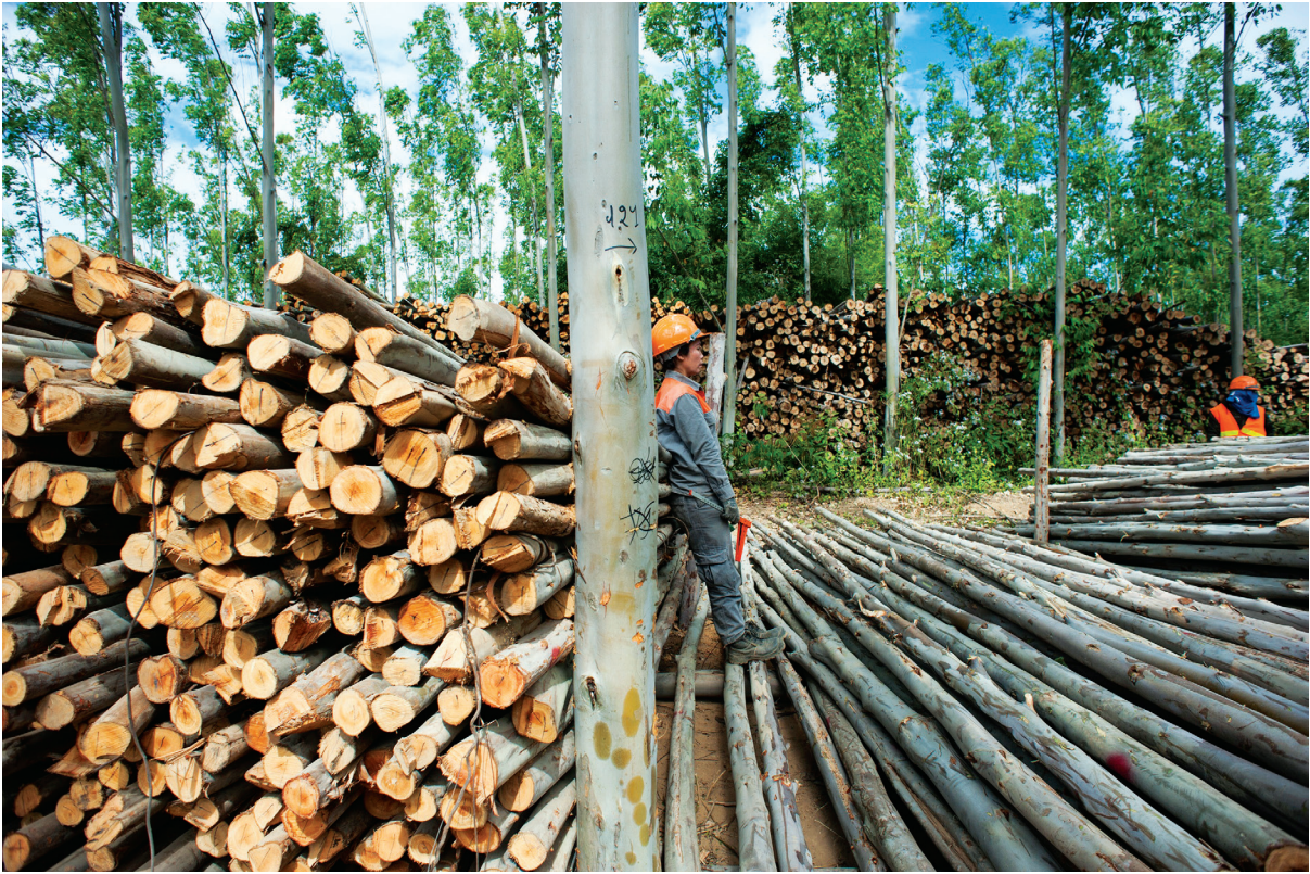
A local employee of Stora Enzo Company leaning against a pile of eucalyptus trees inside the commercial plantation setting up in the village of Ban Lapeung, Ta-oy district, Salavan province, Lao PDR.

កម្រិតនៃការវិនិយោគទុនផ្ទាល់ពីបរទេស គឺខុសៗគ្នាទៅតាមប្រទេសនីមួយៗ ដោយវាអាស្រ័យទៅលើច្បាប់ និងបទប្បញ្ញត្តិក្នុងស្រុក ការលើកទឹកចិត្ត និងភាពទាក់ទាញរបស់ខ្លួន ដែលមានសម្រាប់សង្វាក់ផលិតកម្មនៅក្នុងតំបន់ និងសកលលោក។ មួយវិញទៀត ការវិនិយោគគឺមិនមែនសុទ្ធតែមកពីបរទេសនោះទេ ព្រោះក៏មានការវិនិយោគក្នុងស្រុក ហើយនិងសហគ្រាសឯកជនរបស់រដ្ឋផងដែរ។ មានគម្រោងអភិវឌ្ឍន៍ជាច្រើន ដែលផ្តោតលើវិស័យហេដ្ឋារចនាសម្ព័ន្ធ ថាមពល និងការរុករករ៉ែ ហើយវាគឺជាគម្រោងកម្មវិធីបែបភាពជាដៃគូរវាងរដ្ឋនិងឯកជន ដែលមានសមាសភាពជាសហគ្រាសរដ្ឋខ្លួនឯងផ្ទាល់ ជាសាធារណៈកម្មរបស់ក្រុមឯកញ្ជាៗ ឬអ្នកមានក្នុងស្រុក និងជាកម្មសិទ្ធិរបស់វិនិយោគិនបរទេស ពោលគឺវាអាចជាគម្រោងរបស់សហគ្រាសរដ្ឋ ឬក៏សាធារណៈកម្មឯកជន។ នៅកម្ពុជា ឡាវ និងមីយ៉ាន់ម៉ា ការវិនិយោគទុនផ្ទាល់ពីបរទេសទៅលើវិស័យកសិកម្ម ធ្វើអោយមានការទទួលបាននូវសម្បទានដី ក្រោមកិច្ចសន្យាជួលដីរយៈពេលវែង (រហូតដល់ទៅ៩៩ឆ្នាំ) ហើយជួលនៅក្នុងតម្លៃទាប ដែលដីសម្បទាននោះត្រូវបានប្រើប្រាស់សម្រាប់ដាំដំណាំមួយចំនួន ដូចជាកៅស៊ូ ពោតអំពៅ និងជំទ្រូងមី ដែលទិន្នផលនៃដំណាំទាំងនេះត្រូវបានយកទៅកែច្នៃជាចំណីអាហារ ឬក៏ជាផលិតផលឧស្សាហកម្ម។ ៩