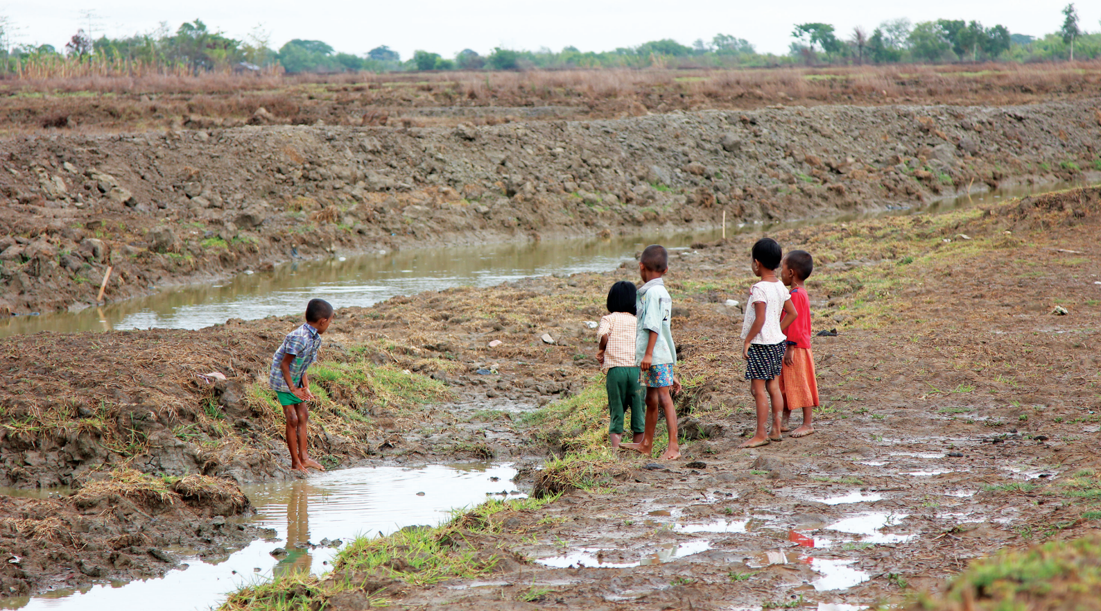
Many of the resettled villagers were farmers, but they did not receive replacement land when they were resettled, so they lost livelihoods. After 3 years, they are still negotiating to receive an area of common land to use for farming, Thilawa Special Economic Zone, Myanmar.

គម្រោងហេដ្ឋារចនាសម្ព័ន្ធវិស័យចម្រុះ ខណៈដែលជំនួយទ្វេភាគីតែងតែភ្ជាប់មកជាមួយនូវការគាំទ្រពីសំណាក់ប្រទេសជាម្ចាស់ជំនួយលើការវិនិយោគឯកជន។ នៅក្នុងអំឡុងពេលតែមួយ ប្រទេសនៅតាមដងទន្លេមេគង្គ មានសមាសភាពជាសមាជិករបស់កម្មវិធីវិនិយោគថ្នាក់តំបន់ផង និងថ្នាក់អនុតំបន់ផង ហើយក៏ជាសមាជិកនៃកិច្ចព្រមព្រៀងវិនិយោគពាណិជ្ជកម្មទ្វេភាគី ថ្នាក់តំបន់ និងថ្នាក់សលកលោក។