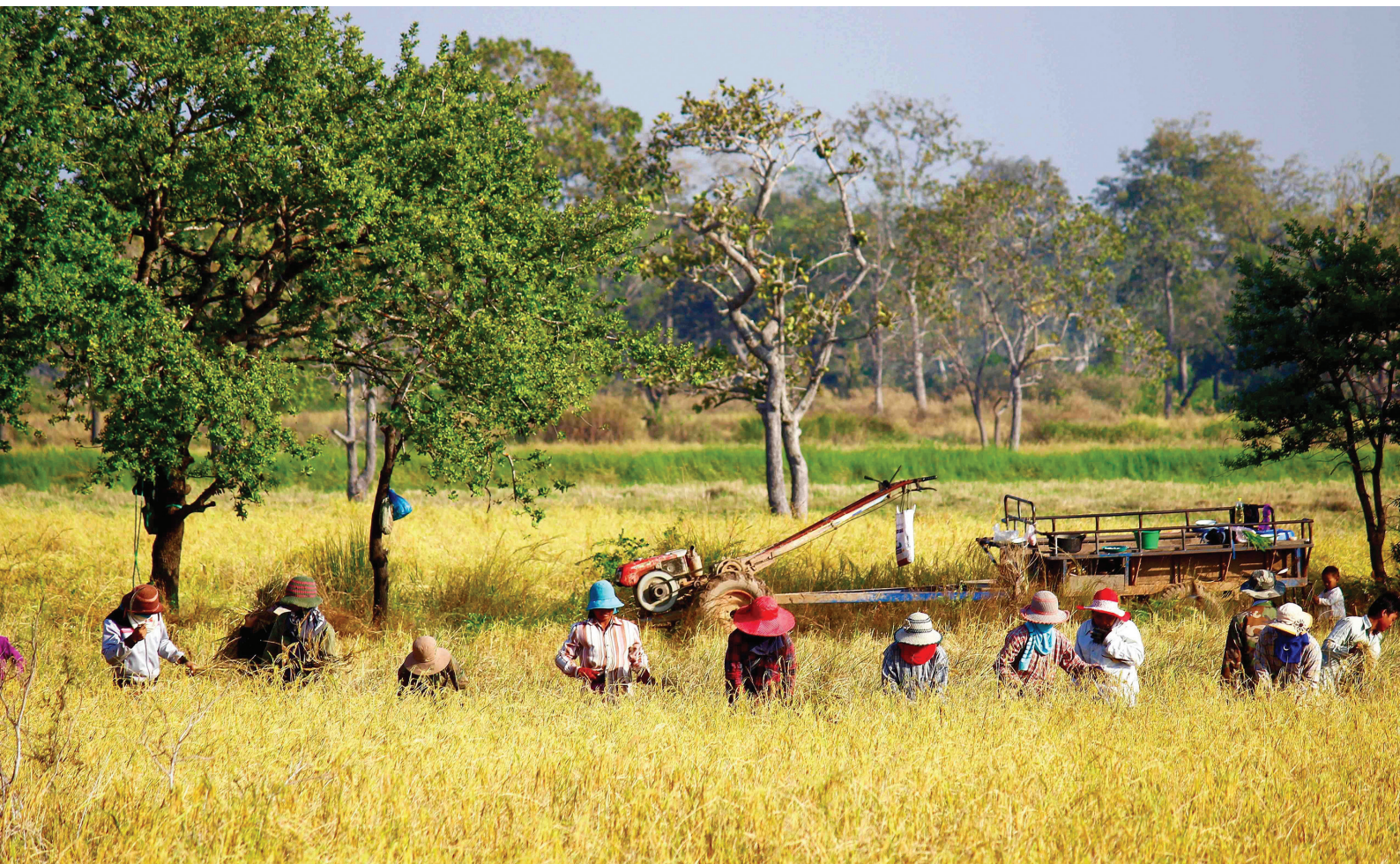
Farmers harvesting in Otdar Meanchey province, Cambodia, 2016.