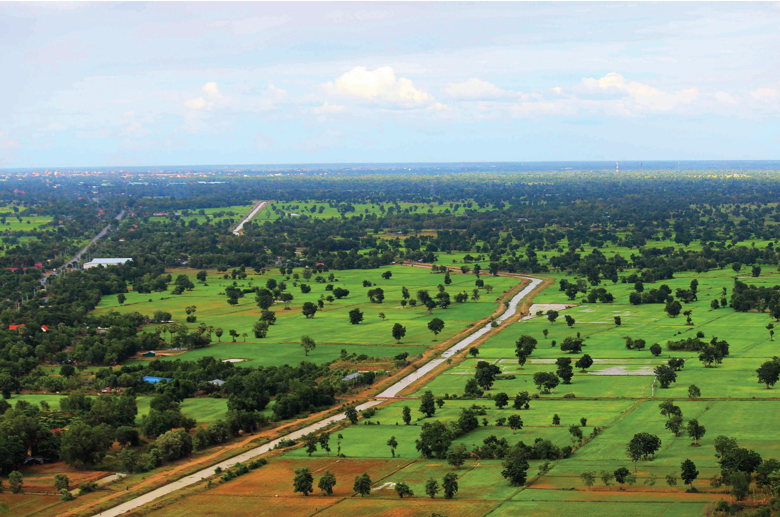
Rice field of Battambang province, Cambodia, 2016.

នៅក្នុងតំបន់ទន្លេមេគង្គទាំងមូលពាក្យ «អភិវឌ្ឍន៍» បានក្លាយទៅជាពាក្យដែលមានន័យថានៃកំណើនសេដ្ឋកិច្ច ដែលការ