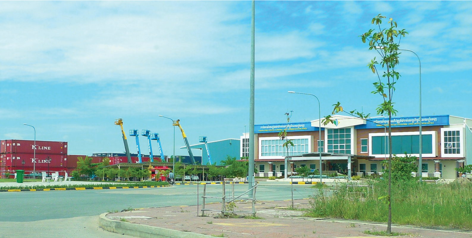
Administration office of Phnom Penh Special Economic Zone, Cambodia, 2016.

គោលនយោបាយសេដ្ឋកិច្ចជាតិរបស់កម្ពុជា បទប្បញ្ញត្តិ និងក្របខ័ណ្ឌវិនិយោគធ្វើឲ្យប្រទេសនេះ ក្លាយទៅជាប្រទេស ដែលមានសេដ្ឋកិច្ចលឿនខ្លាំងជាងគេបំផុតនៅក្នុងតំបន់ និងក៏ជាប្រទេសដែលផ្តល់បរិយាកាសអំណោយទានសម្រាប់វិនិយោ គិនក្នុងស្រុកនិងបរទេសជាងគេផងដែរ។ ១២ ការលើកទឹកចិត្តវិនិយោគិនបរទេសដើម្បីទាក់ទាញវិនិយោគទុន រួមមានជន បរទេសមានសិទ្ធិធ្វើជាម្ចាស់ក្រុមហ៊ុន១០០ភាគរយ ទទួលបានការលើកលែងពន្ធសារពើរកម្មរហូតដល់ទៅប្រាំបីឆ្នាំ បន្ទាប់ពី អំឡុងពេលលើកទឹកចិត្តផុតកំណត់ហើយនោះ អត្រាពន្ធសារពើរកម្មគឺមានត្រឹមតែ២០ភាគរយប៉ុណ្ណោះ នាំចូលទំនិញ ដោយរួចពន្ធ និងគ្មានលក្ខខណ្ឌហាមឃាត់ចំពោះការបង្វែរទុនទៅស្រុកវិញ។ វិនិយោគិនបរទេសក៏អាចដាក់ពាក្យស្នើ សុំដីសម្បទានសេដ្ឋកិច្ចបានដែរ។