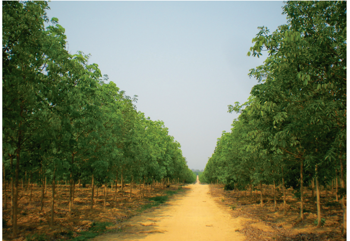
A rubber plantation in Savannakhet, Lao PDR, by a Vietnamese company.

កាលពីខែកក្កដា ឆ្នាំ២០១៦ដែលនេះ ហ្វ័រមេសក៏បានសម្ភាសជាមួយនឹងថ្នាក់ដឹកនាំសហជីពឯករាជ្យម្នាក់និងបុរសជាកម្មករម្នាក់នៅក្នុងតំបន់សេដ្ឋកិច្ចពិសេសផ្សេងមួយទៀតនៅកម្ពុជា គឺតំបន់សេដ្ឋកិច្ចពិសេសភ្នំពេញ (PPSEZ) ហើយអ្នកទាំងពីរបានស្នើសុំមិនបញ្ចេញអត្តសញ្ញាណនោះទេ។ ពួកគេបានរាយការណ៍ថាការបង្កើតសហជីពគឺត្រូវបានរឹតត្បិតនៅក្នុងតំបន់សេដ្ឋកិច្ចពិសេសភ្នំពេញ ជាពិសេសជាមួយនឹងសហជីពដែលចូលរួមធ្វើក្នុងកម្មទាមទារដំឡើងប្រាក់ខែគោលកាលពីឆ្នាំ២០១៤។ ប្រសិនបើក្រុមហ៊ុនដឹងថាកម្មករកំពុងតែព្យាយាមបង្កើតសហជីពមួយនៅក្នុងក្រុមហ៊ុន របស់ពួកគេ