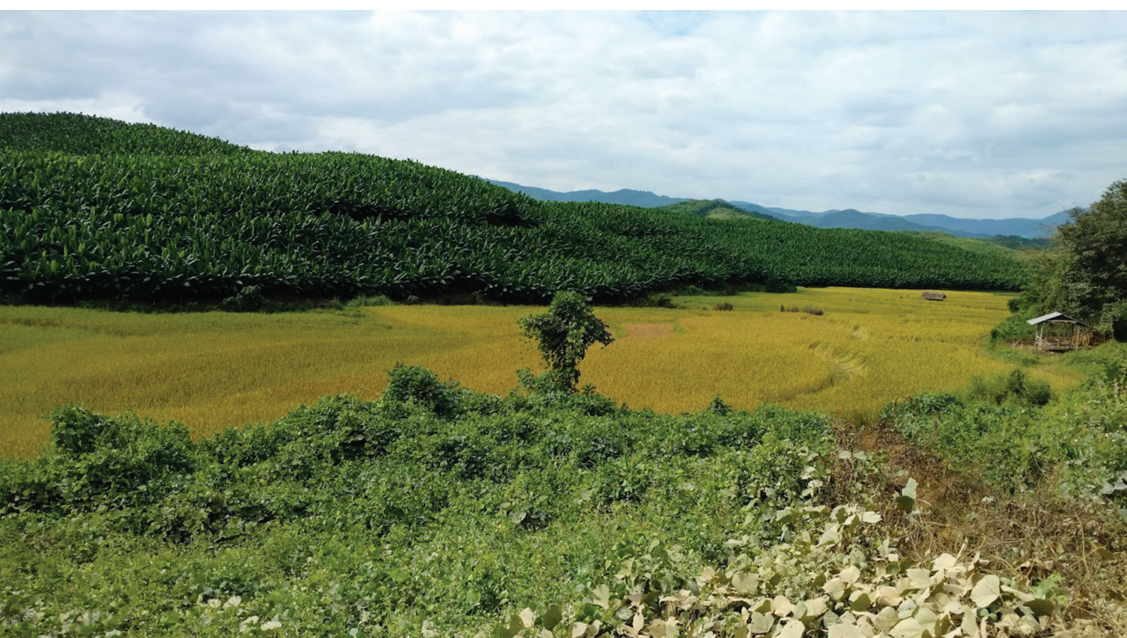
A Banana plantation in Luang Phabang, Lao PDR.

សំណួរមួយក្នុងចំណោមសំណួរទាំងអស់ដែលមានលក្ខណៈស៊ីជម្រៅអំពីនិន្នាការវិនិយោគនៅក្នុងតំបន់ទន្លេមេគង្គនោះគឺនៅមូលដ្ឋានតើការវិនិយោគទាំងនោះនឹងធ្វើឱ្យមានផលប៉ះពាល់យ៉ាងដូចម្តេចខ្លះដល់សេដ្ឋកិច្ច ការងារ ជីវភាពរស់នៅបរិស្ថាន សន្តិសុខស្បៀង និងការទទួលបាននូវសេវាសំខាន់ៗសម្រាប់ប្រជាជននៅក្នុងតំបន់ ដែលប្រជាជនភាគច្រើនធ្វើការដាំដុះដោយខ្លួនឯងគ្រាន់បានមួយគ្រប់ៗសម្រាប់តែចិញ្ចឹមជីវិតប៉ុណ្ណោះ ហើយពួកគេមានការពឹងផ្អែកអាស្រ័យផលយ៉ាងខ្លាំងក្លាទៅលើបរិស្ថានដែលនៅជុំវិញខ្លួនរបស់ពួកគេដើម្បីរស់រានមានជីវិត។ កិច្ចព្រមព្រៀងពាណិជ្ជកម្ម និងវិនិយោគ គឺកម្រនឹងបង្កើតឡើង ដោយមានការចូលរួមពីសំណាក់ប្រជាជនឬសហគមន៍នៅមូលដ្ឋានណាស់ ហើយដំណើរការចរចាលើកិច្ចព្រមព្រៀង ឬកិច្ចព្រមព្រៀងទាំងនេះ ក៏មិនត្រូវបានដាក់ឱ្យមានការត្រួតពិនិត្យ តាមបែបប្រជាធិបតេយ្យជាតិដែរ។ ផលប៉ះពាល់អវិជ្ជមាននោះគឺ ប្រជាជនទទួលបានតិចតួច ឬក៏មិនទទួលបាននូវយុត្តិធម៌និងសំណងទាល់តែសោះខណៈដែលការវិនិយោគ ផលប្រយោជន៍ និងអភ័យឯកសិទ្ធិរបស់វិនិយោគិនខ្នាតធំត្រូវបានការពារដោយច្បាប់ ឬដោយការរៀបចំនិងដោយទំនាក់ទំនងដែលមិនផ្លូវការនានា។ នៅក្រោមលក្ខខណ្ឌបែបនេះ ផលប្រយោជន៍របស់ប្រជាជនមូលដ្ឋានដែលទទួលបានពីការវិនិយោគខ្នាតធំគឺមានតិចតួចខ្លាំងណាស់ ហើយយឺតយ៉ាវខ្លាំងទៀតផង។